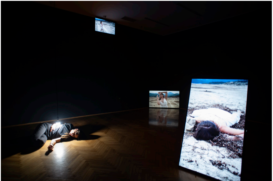
Čiji su moji snovi, mix media: performans, devetokanalna video-instalacija, audio, svjetlo, 2022.